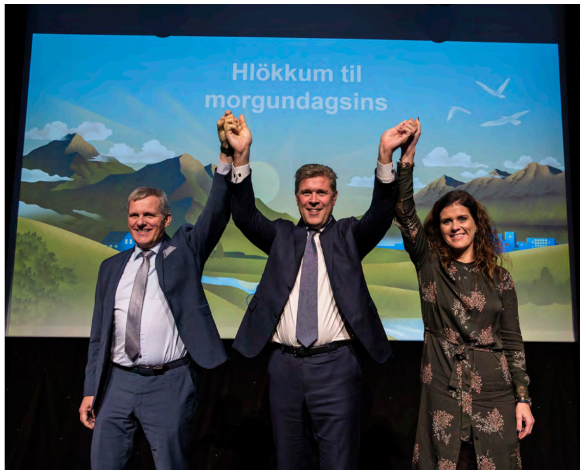
Forysta Sjálfstæðisflokksins á flokksráðsfundi í september 2019.

Sjálfstæðisflokksins byggist á aðskilnaði milli þeirra sem hafa efni á að kaupa slíka þjónustu og hinna sem hafi ekki efni á því. En stefna okkar er og hefur alltaf verið sú að allir Íslendingar hafi aðgang að sama heilbrigðis- og menntakerfi frá vöggum til grafar. Það á ekki að skipta máli hvaða bakgrunn fólk hefur. Við höfum fjölmörg dæmi um að okkur hafi tekist að byggja upp þjónustu með einkaframtaki, svo sem tannlækningar og sjálfstætt starfandi heilsugæslustöðvar. Eins er gagnrýnt að einhverjir geti hagnast á að veita slíka þjónustu, en það má til dæmis leysa með því að fjármagn sé bundið einstaklingum innan kerfisins. Þá njóta menn hagræðisins sem skapast með einkaframtakinu og landsmenn njóta betri þjónustu. Það hefur gefist vel á höfuðborgarsvæðinu og nú er unnið að því að koma slíku kerfi upp annars staðar á landinu. Við höfum ekki fundið annað en ánægju með það og að það bæti aðgengi að heimilislæknum. Að sjálfsögðu á þetta ekki við um hvaða heilbrigðisþjónustu sem er, en við höfum nægilega mörg dæmi um að þetta sé skilvirkt og skili góðri niðurstöðu fyrir heilbrigðiskerfið okkar til að vera opin fyrir því að þróa kerfið áfram.“