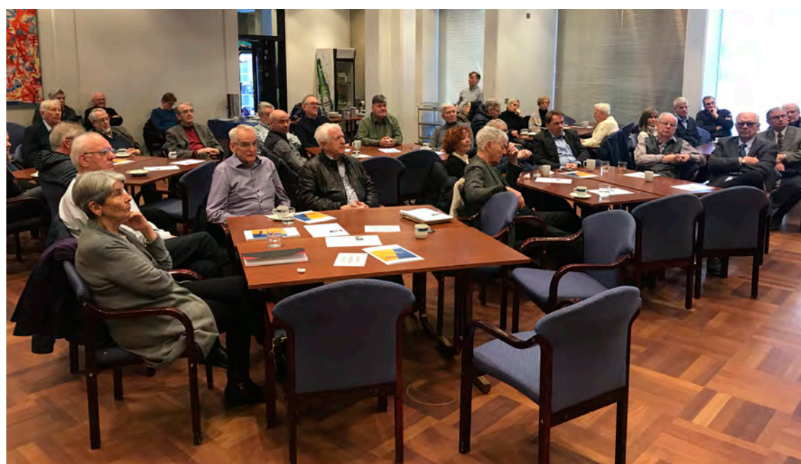
Það er jafnan fjölmennt á fundum Samtaka eldri sjálfstæðismanna sem haldnir eru í Valhöll.