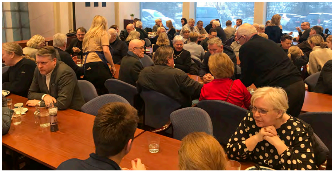
Fjöldmenni kom plockkarann í Valhöll. Næsta plockfiskveisla verður 22. febrúar nk.

margir hönd á plóg og allir stóðu sig með þryði. Það er góð reynsla af því í Sjálfstæðisflokknum að halda fundi og samkomur á laugardögum og er jafnan vel mætt á þá viðburði. Þar hittist fólk og