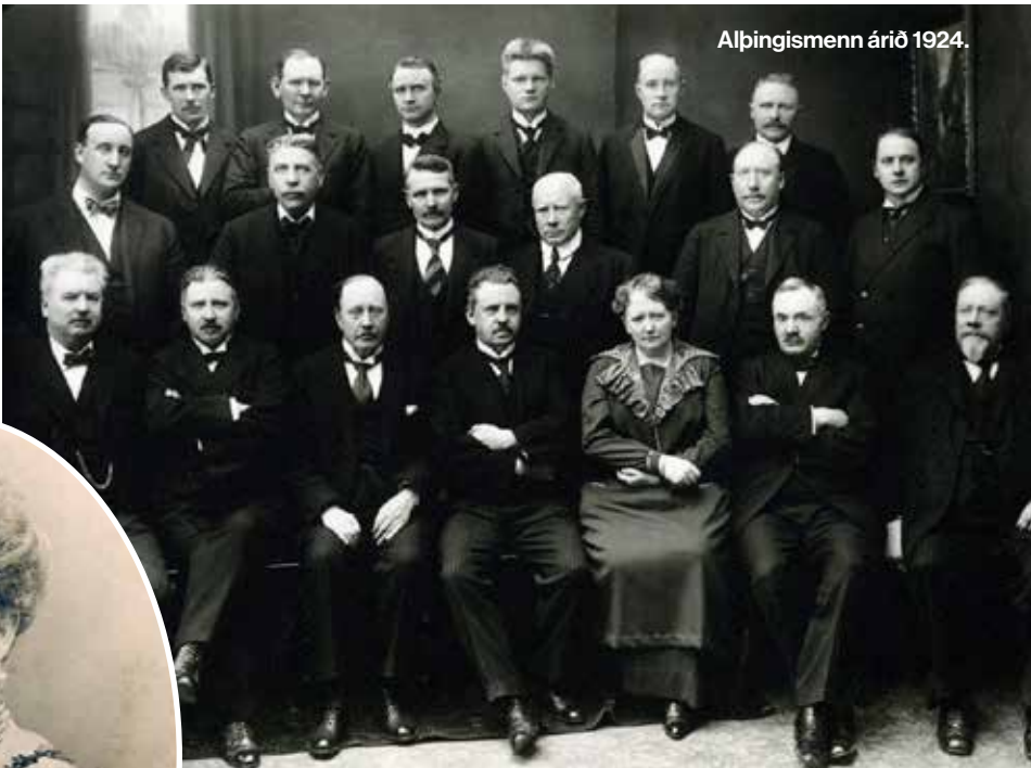
Alþingismenn árið 1924.