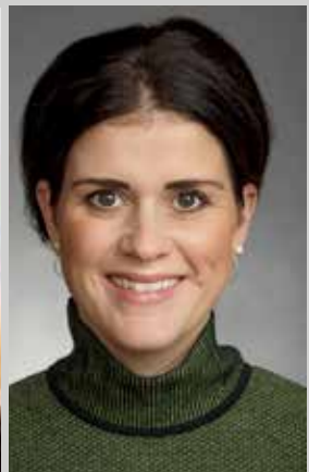
Þórdís Kolbrún R. Gylfadóttir, ferða- mála- iðnaðar- og nýsköpunarráðherra